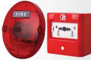
> آژیر فلاشر و شستی اعلان حریق آدرس پذیر