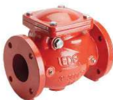
شیر یک طرفه Check Valve

بدنه از فولاد سخت رنگ شده و رینگ آبیمنده کننده EPDM و هسته داخلی از فولاد ضد زنگ