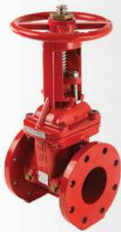
شیر فلکه دروازه ای OS&Y