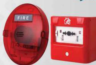
&lt; آژیر فلاشر و شستی اعلان حریق متعارف