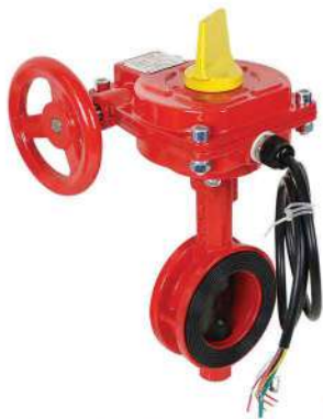
شیر فلکه پروانه ای با ارسال سیگنال Butterfly Valve