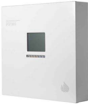
مرکز کنترل آدرس پذیر &lt;