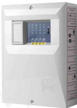
&lt; مرکز کنترل متعارف