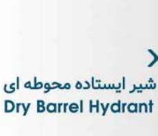
شیر ایستاده محوطه ای Dry Barrel Hydrant