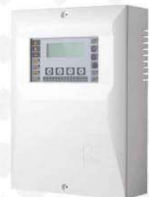
&lt; تکرار کننده متعارف