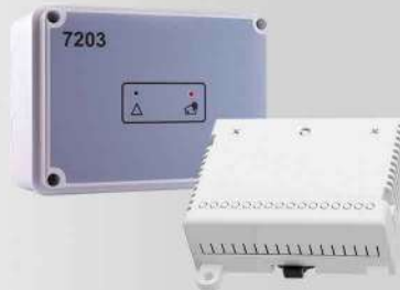
&lt; اینترفیس اعلان حریق آدرس پذیر