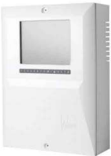
&lt; تکرار کننده آدرس پذیر